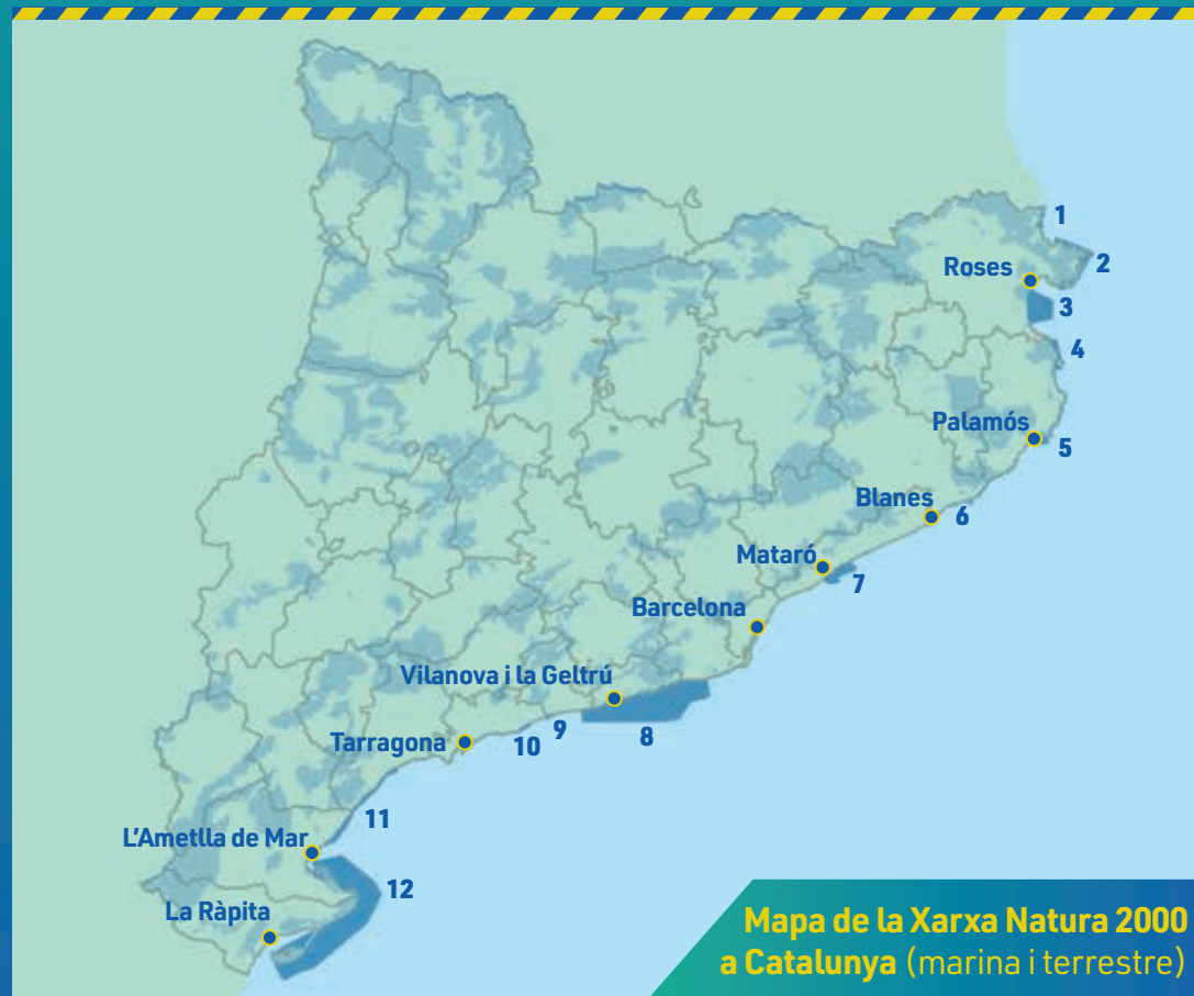
Mapa de la Xarxa Natura 2000 a Catalunya (marina i terrestre)