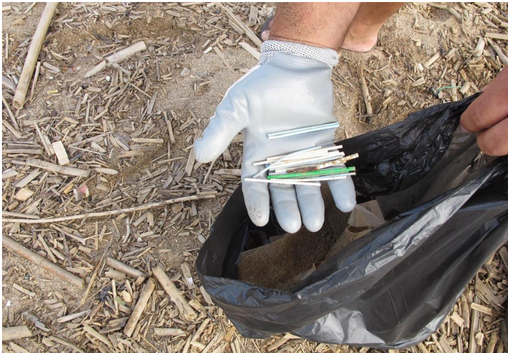
Fig. 5: comptatge de residus recollits per tal de ser anotats al formulari.

El ritme que s'ha de seguir al dur a terme el mostreig és lent, ja que sinó ens deixarem de recollir els elements de mida petita, que tendeixen a ser els que més s'acumulen a les platges.