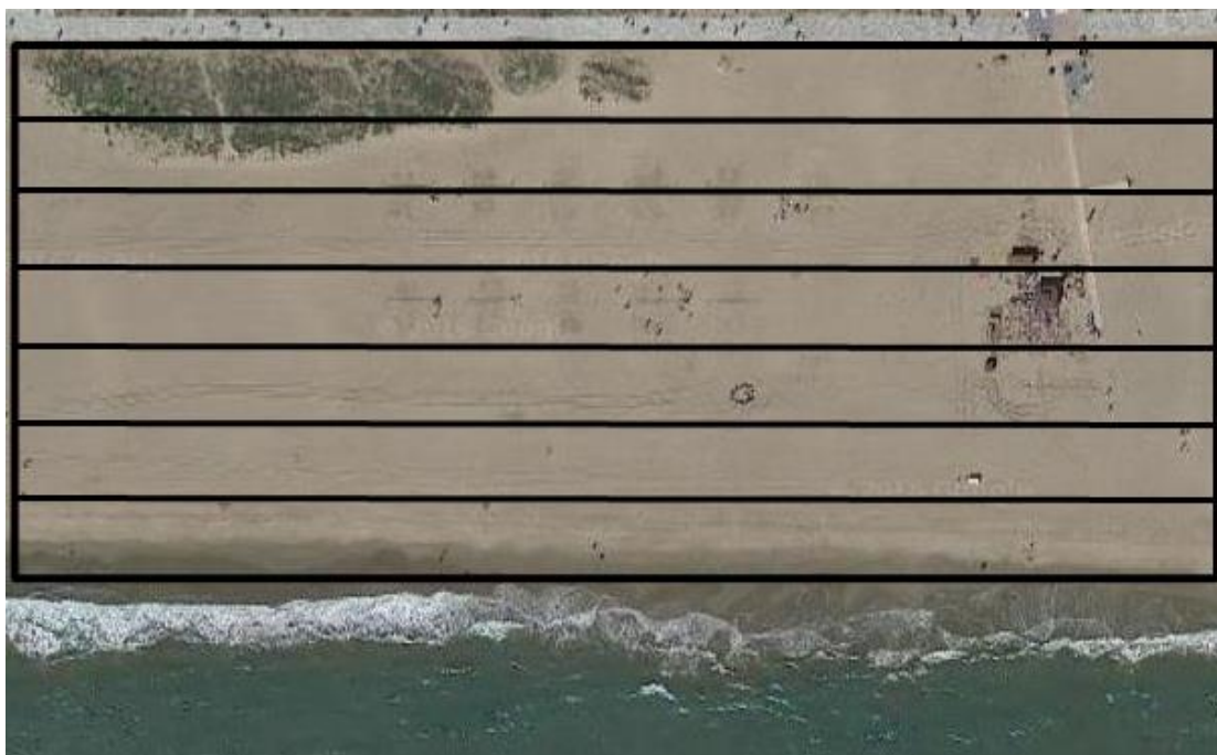
Fig. 3: esquema del que seria la divisió d ela parcel·la en sub-parcel·les.