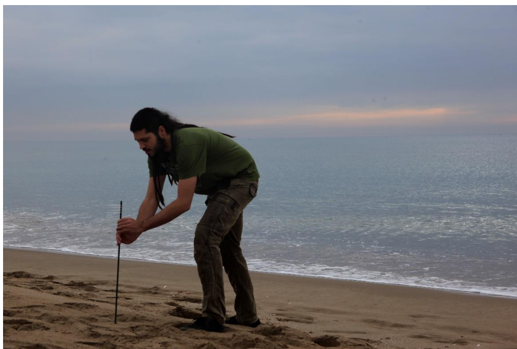
Fig.2: instal·lació d'una piqueta per delimitar una parcel·la de mostreig.

És important que les parcel·les es puguin identificar visualment, pel que es recomana poder utilitzar elements que ajudin a fer-ho com ara pals o piquetes (fig. 2). Per poder localitzar les parcel·les en els mostrejos posteriors és important poder marcar les seves coordenades amb un GPS.