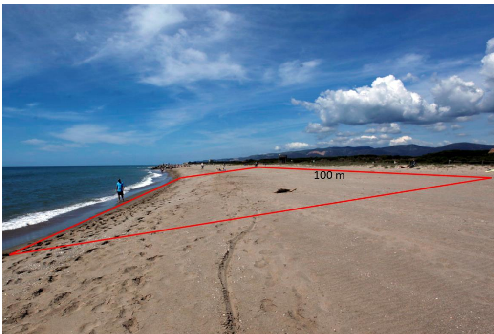
Fig. 1: exemple de parcel·la a la platja.

És important que les parcel·les es puguin identificar visualment, pel que es recomana poder utilitzar elements que ajudin a fer-ho com ara pals o piquetes (fig. 2). Per poder localitzar les parcel·les en els mostrejos posteriors és important poder marcar les seves coordenades amb un GPS.