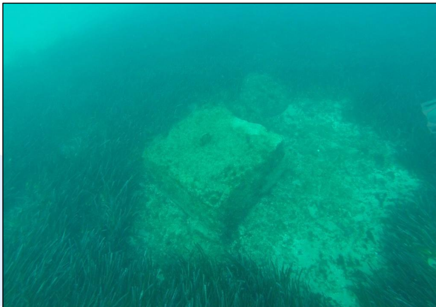
Muerto de fondeo en una pradera de posidonia. Se puede apreciar la afectación de la posidonia a su alrededor debida al movimiento del fondeo.

Una de las principales causas de regresión de las praderas de posidonia es la instalación inadecuada de sistemas y materiales para el fondeo fijo de embarcaciones